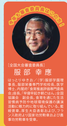
【全国大会審査委員長】